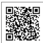
Vídeo Bronson 34 (Steeler Yachts)

Steeler Yachts es un astillero holandés que en las dos últimas ediciones obtuvo el galardón del European Power Boat of the Year 2015 con la Panorama 47 en la categoría de modelos de desplazamiento; y