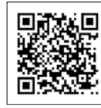
Video Bénéteau Swift Trawler 30 (Bénéteau)

Es la última incorporación a la gama de las Swift Trawler de Bénéteau, que en una eslora de tan solo una decena de metros es capaz de combinar todos los elementos de un barco viajero, con larga autonomía y con las prestaciones de un apartamento flotante.